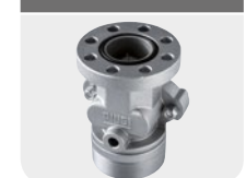
with integrated valve Code F17163000