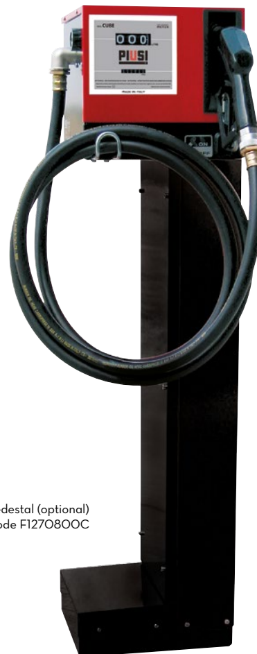
Pedestal (optional) Code F1270800C