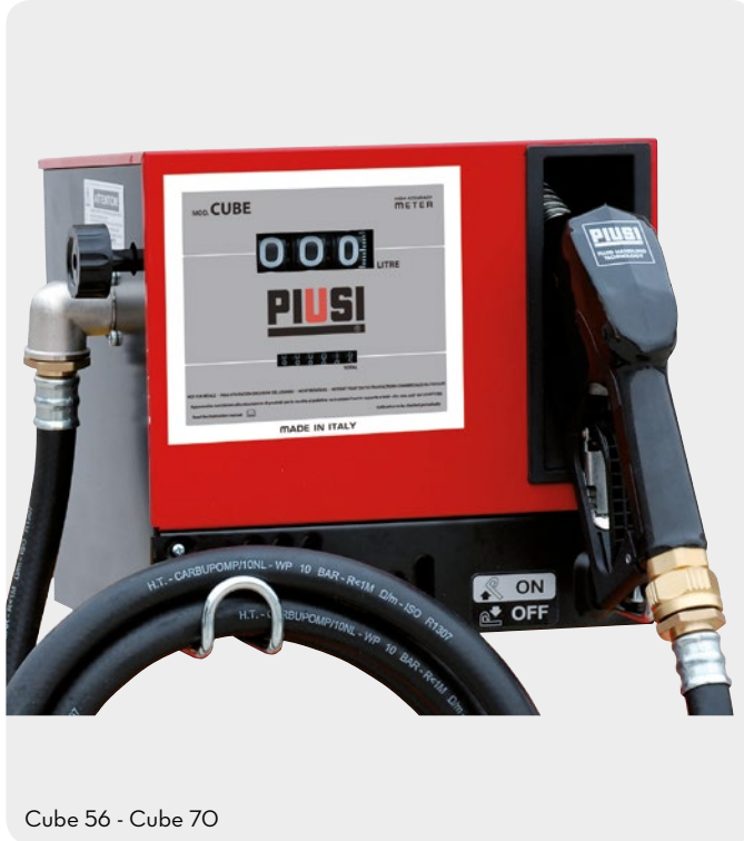
Cube 56 - Cube 70